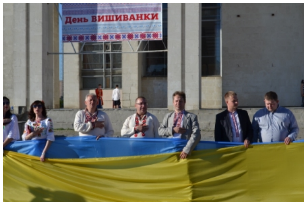
Вишиванка - наш генетичний код

21 травня в місті Первомайський відбулися урочисті заходи присвячені Дню вишиванки, в яких взяли участь мешканці міста та району, керівники районної та міської влади. Єдиною великою колоною пройшли по місту сотні мешканців у вишиванках, а в руках учасники несли полотнища кольорів національного прапора України.